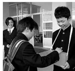
▲生徒玄関前での募金の様子

自分たちができる支援を考え、その思いをかたちにしている姿は明るく輝いていました。