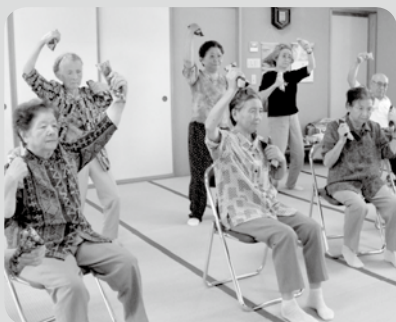
ふれあいいきいきサロン

皆さまから寄せられた会費は、高齢者や障がい者の生活支援をはじめ、ふれあいいきいきサロンや移送サービスなど、様々な地域福祉活動に活用させていただきます。