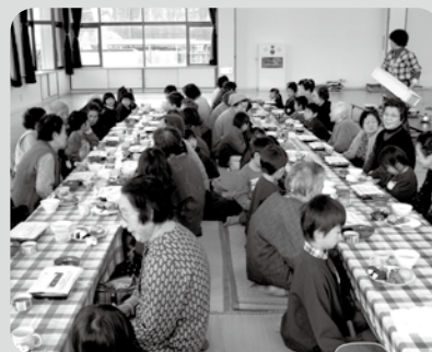
ふれあい招待昼食会