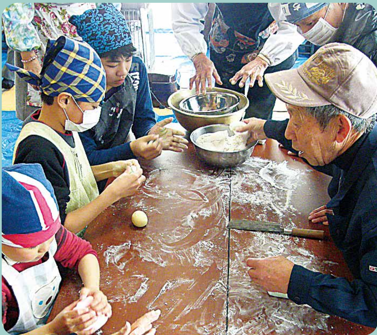
【瓜生屋の茶の間でのやせごま作りの様子】