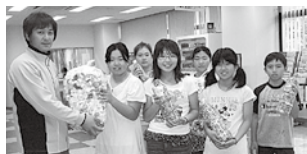
▲赤泊小学校の皆さん

やはたの里/歌代の里/すこやか両津/親里/新穂愛宕の園/岩の平園/ろうきん/明治安田生命保険/三井生命保険 萬屋商店/佐々木モータース/ビューさわた/伊藤建設/金井電設/環境保全事業/とぎの郷ゴルフクラブ/蛇の目寿司/パークドライ/両津管工事業協同組合/勝伝寺間法会/両津給食センター/JA佐渡/佐渡市/佐渡総合病院/羽茂病院/佐和田商工会女性部/金井商工会女性部/赤泊商工会女性部/手話サークル/椎崎長寿会/消費者協会/椎泊保育園/湊保育園/夷保育園/畑野保育園/川西保育園/河崎小学校/加茂小学校/両津小学校/河原田小学校/二宮小学校/新穂小学校/行谷小学校/畑野小学校/赤泊小学校/前浜中学校/南中学校/畑野中学校/羽茂中学校/佐渡看護専門学校 この他、個人の方からもたくさん集めていただきました。