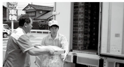
▲運搬にご協力いただいているセーブオンの方々