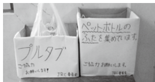
▲畑野小学校のキャップ収集箱

平成23年4月～12月までにお寄せいただいたペットボトルキャップは、 3,480.7kg（ポリオワクチン1,740人分） となりました。