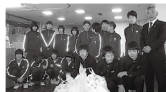
▲畑野中学校の皆さん

キャップを集めてくださった皆さん、運搬にご協力いただいているセーブオン各店の皆さん、ありがとうございました。