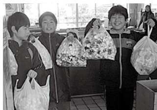
▲行谷小学校の皆さん