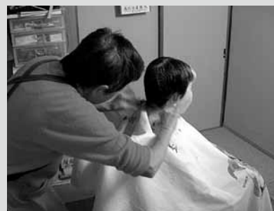
▲出張理容サービス