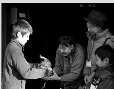
▲お餅とお蕎麦の配布