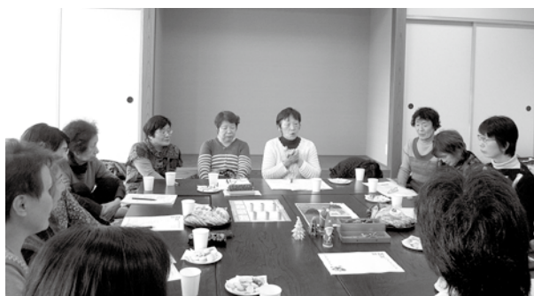
▲傾聴ボランティアの交流会の様子