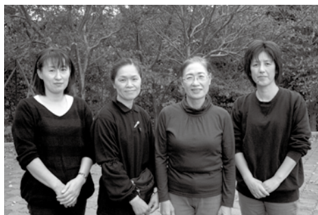
▲佐渡要約筆記サークルのみなさん

発足当初は「要約筆記」そのものが知られてなく、こちらの方から、派遣依頼をお願いしていましたが、今では、県はもちろん、市からも依頼が来るようになりました。各種講演、個人依頼もあります。毎月第1月曜日を学習の日と決め、技術を磨き、聴覚障がい者も社会参加ができるよう、ボランティア活動を続けています。