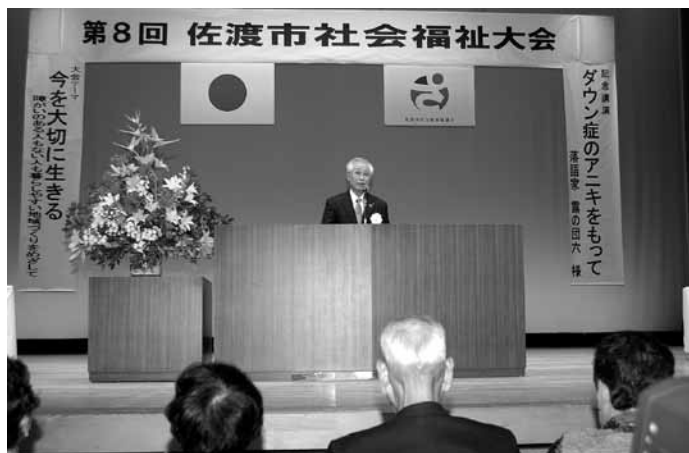
▲第8回佐渡市社会福祉大会の様子

障がいを抱えるということは誰にでも起こり得ることでありながら、障がいに対しての理解があまり進んでいないのが現状です。このような状況の中で、すべての人々が暮らしやすい社会をつくっていくには、一人ひとりの