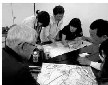
▲災害ボランティア講座

ボランティアの交流会等を開催し、情報交換を行いお互いの連携を深めたり、ボランティアルームを活用し、ボランティア活動へのきっかけづくりに取り組みました。