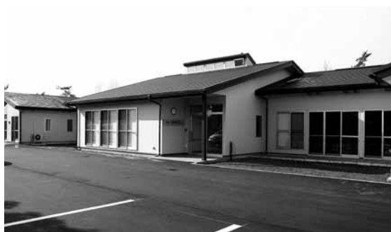
▲グループホームまの