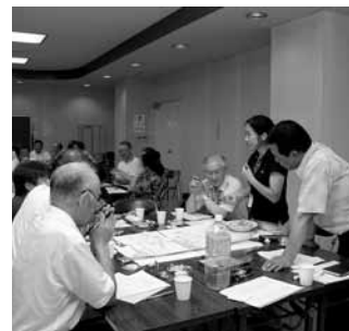
▲地域福祉活動計画策定のための地域懇談会