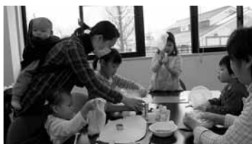
▲ファミリーサポートセンター会員交流会の様子（アロマ石けんづくり）

子育て支援事業として、地域で安心して子育てができるように、ファミリーサポートセンター講習会や交流会、また、児童館料理体験教室などを開催しました。