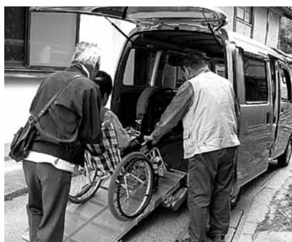
▲移送サービスで利用者宅訪問

高齢者の閉じこもり防止や孤独感の解消のため、地域の茶の間やふれあいいきいきサロン等を開催しました。前年度より多くの方が参加しました。