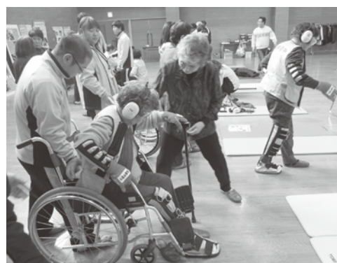
▲シニア体験の様子