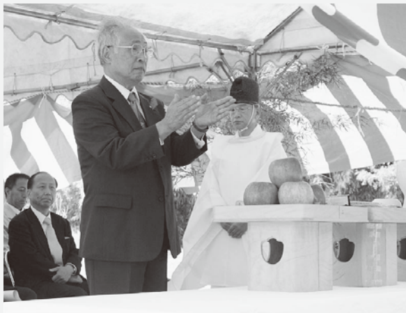
▲工事安全祈願祭の様子