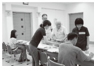
▲ボランティア受付