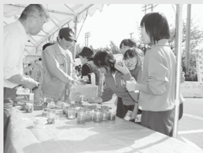
▲社協まつりの様子

住民活動のためのボランティア育成事業、地域の茶の間事業、広報紙の発行、福祉まつりなどに使われます。