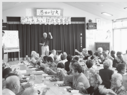
▲ふれあい昼食招待会

ひとり暮らしの高齢者にお弁当をお届けする配食サービス事業や、ふれあい昼食招待会などの高齢者福祉活動に使われます。