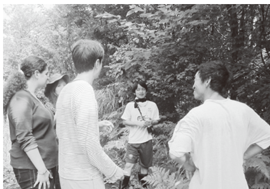
▲「ふるさとの森」を散策

「一度、佐渡に来たかったんです。」地域交流を求めて佐渡に来島した国際ワークキャンプの参加者は、森の草刈り、そば作りなどを体験。また、地元で開催される祭りに参加します。