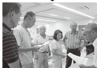
▲ボランティアチーム編成