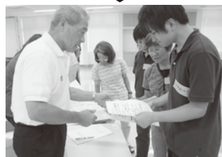
▲現地へ出発します！