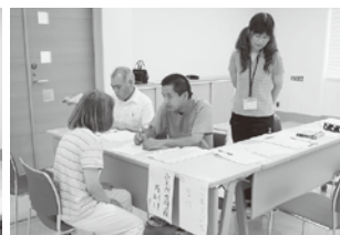
▲ボランティア希望の聞きとり