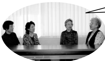
▲意気込みを話す茶の間の ボランティアさんたち

「地域の皆さんが 主体となれるよう な…そこにいくと楽し いことがある」という 茶の間にしていきたい です。お気軽に 遊びにきてください。