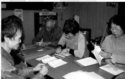
▲菊池会長から点字を習う ともしび会の会員の皆さん

ともしび会とは、点訳と音訳のボランティアの会です。視覚障がいの方々に本や情報誌を読んだり、点字を打つて、童話や本を読んだり、情報提供をする点訳活動をしています。メンバーは12人で、主婦・会社員・自営業者などあらゆる方が所属しています。依頼があれば、点字体験をしてもらうために島内の学校にも出向きます。 また、会員自身も点字の技術を更に磨くため、日々勉強を続けています。会員の方は、もともと視覚障がい者の支援をする基盤ができていてほしいと強く語っていました。仲間になって活動してくれる方お待ちしています。