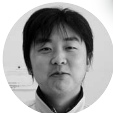
小木ステーション ☎86-3838 桃井