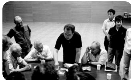
▲昨年の災害講座の様子。