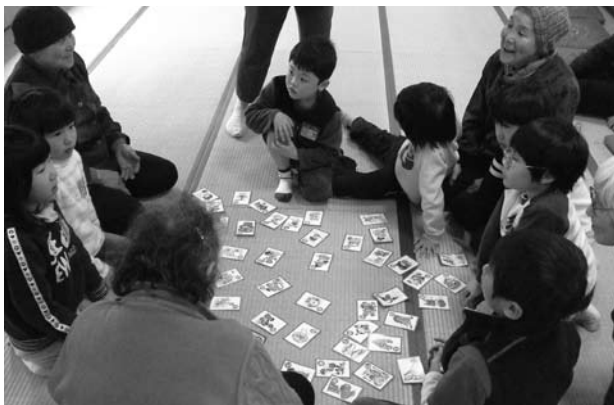
▲赤泊いきいきサロンで小学生とカルタとり

市民の皆さんの疑問に 答えるコーナー。 第一回目は、社協とは どういう団体なのかをお 話します。