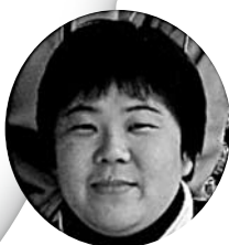
佐和田ステーション ☎57-8141 坂下