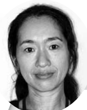
新穂ステーション ☎22-3300 隅田