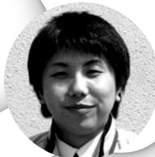
羽茂ステーション ☎88-3838 城腰