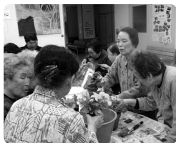
▲小木地区 けんこうくらぶ