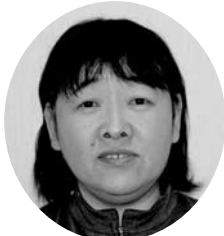
相川ステーション ☎74-0055 大坂