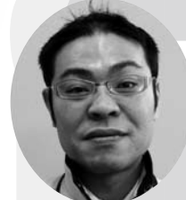
両津ステーション ☎23-5500 長坂