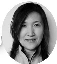
真野ステーション ☎55-4012 滝川