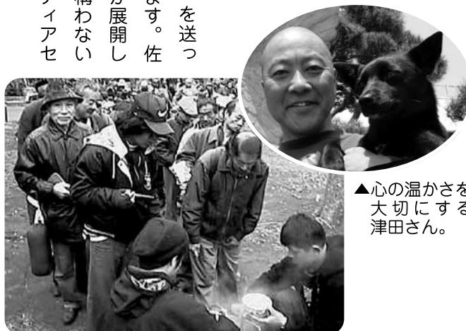
▲心の温かさを大切にする津田さん。