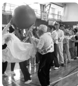
▲新穂地区老人クラブ 運動会