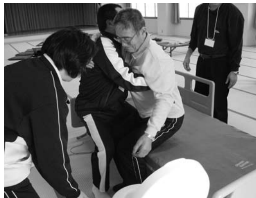
▲両津 男性のための介護教室での様子

また社協は、地域に暮らす住民の参加を原則として、子どもからお年寄り、障がい者などに限らず、環境・保健・医療、行政機関を始め、ボランティア、学校、企業、各種団体、福祉施設等と連携