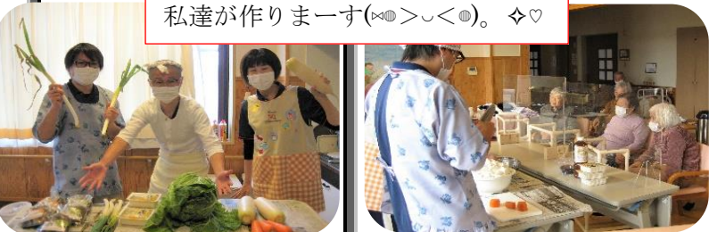
私達が作りまーす(◡>◡<◡)。♡♡

～食の秋～ 秋恒例の振舞い行事が行われました。大人気のあったかキノコ汁と職員の手で収穫した慢の魚沼産コシヒカリ!(^^)!今年も食べられると待ち望まれた方もいたのではないのでしょうか。