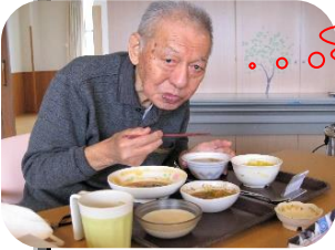
あつたまりますねえ

利用者様に見守られ時にご指導頂きながら、職員のお手並み拝見となりました。栄養満点、出来立て熱々をさあどーぞ(*^^*)