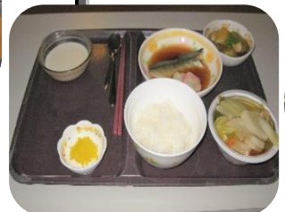
美味しく頂きました!