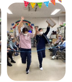
職員も頑張ります!!