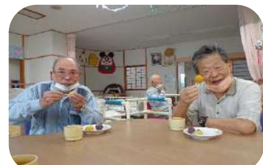
美味しく出来ました!(^^)!