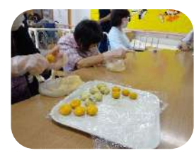
茶きんの形に整えます。