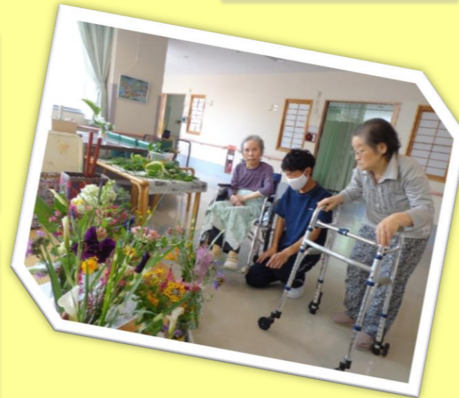
春風堂 園芸クラブ～生け花～