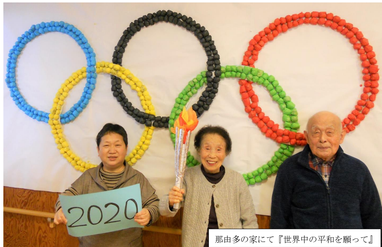
那由多の家にて『世界中の平和を願って』

1月に入社しました。利用者様に安心・安全に介護を提供出来るよう日々勉強中です。ご迷惑をおかけする事が多いとは思いますが、お役に立てるよう頑張ります。よろしくお願いいたします。