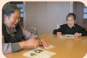
煮干しを砕いてね~