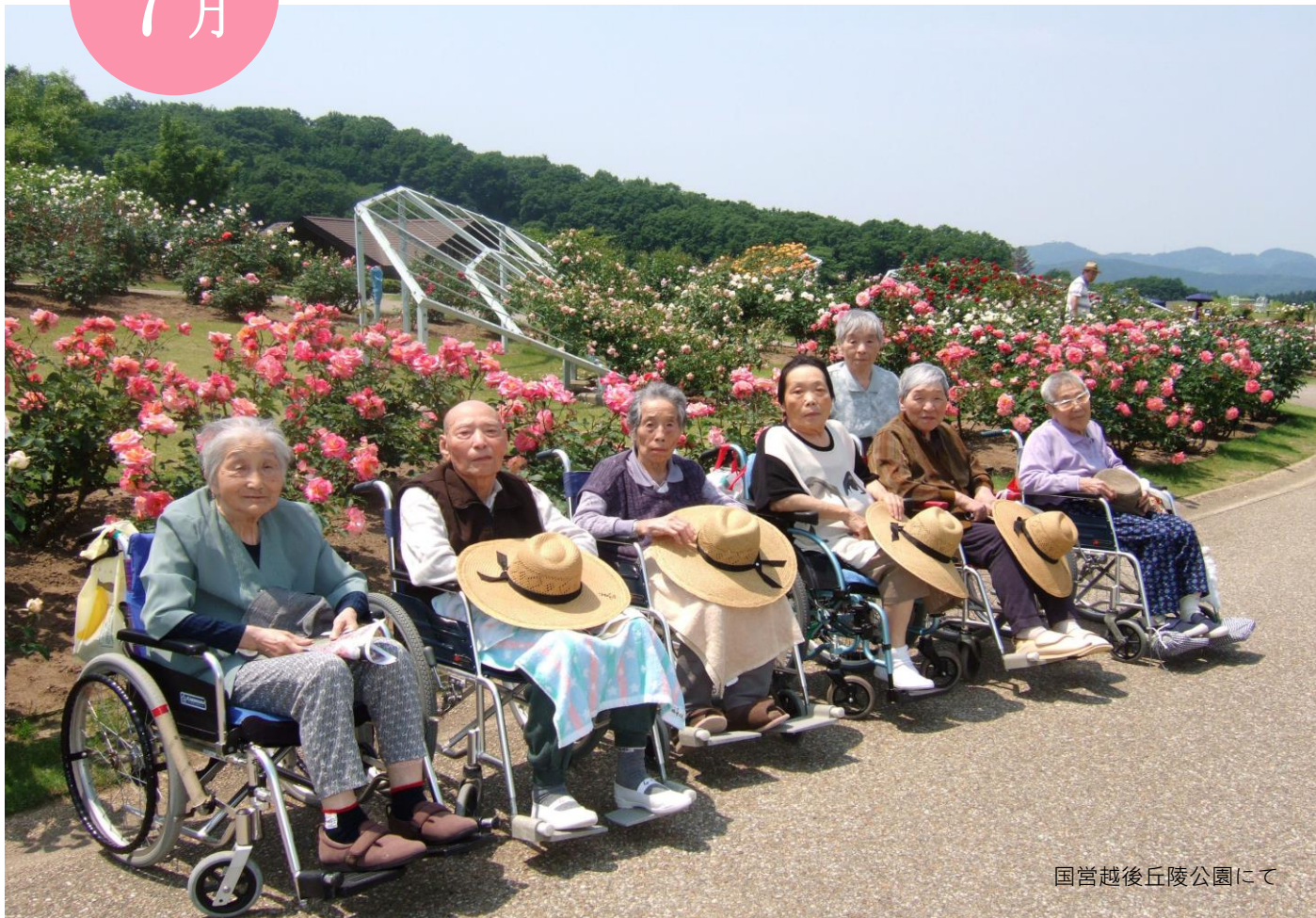
国営越後丘陵公園にて