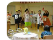
上/山婦人会 防火クラブ