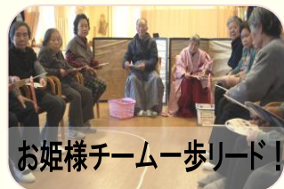
お姫様チーム一歩リード!

今年は春の訪れが早く、桜も早く開花しそうです。毎年恒例となりました、ひな祭りにゲームをしました。お内裏様とお雛様2つのチームに分かれ、物送りゲームをし、勝った方からひな人形の服を着て頂きます(*^_^*)