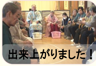
出来上がりました!