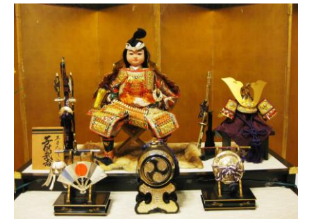
※那由多の家にて飾っております