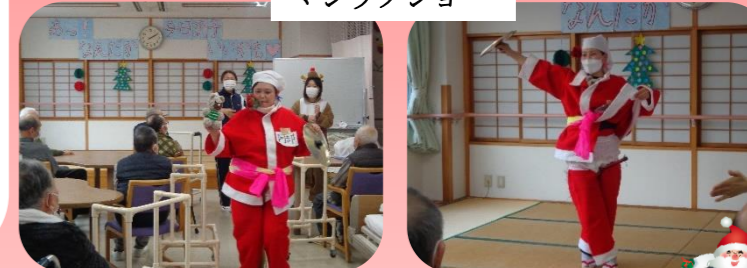
サンタさん、どこが違うの？クイズ