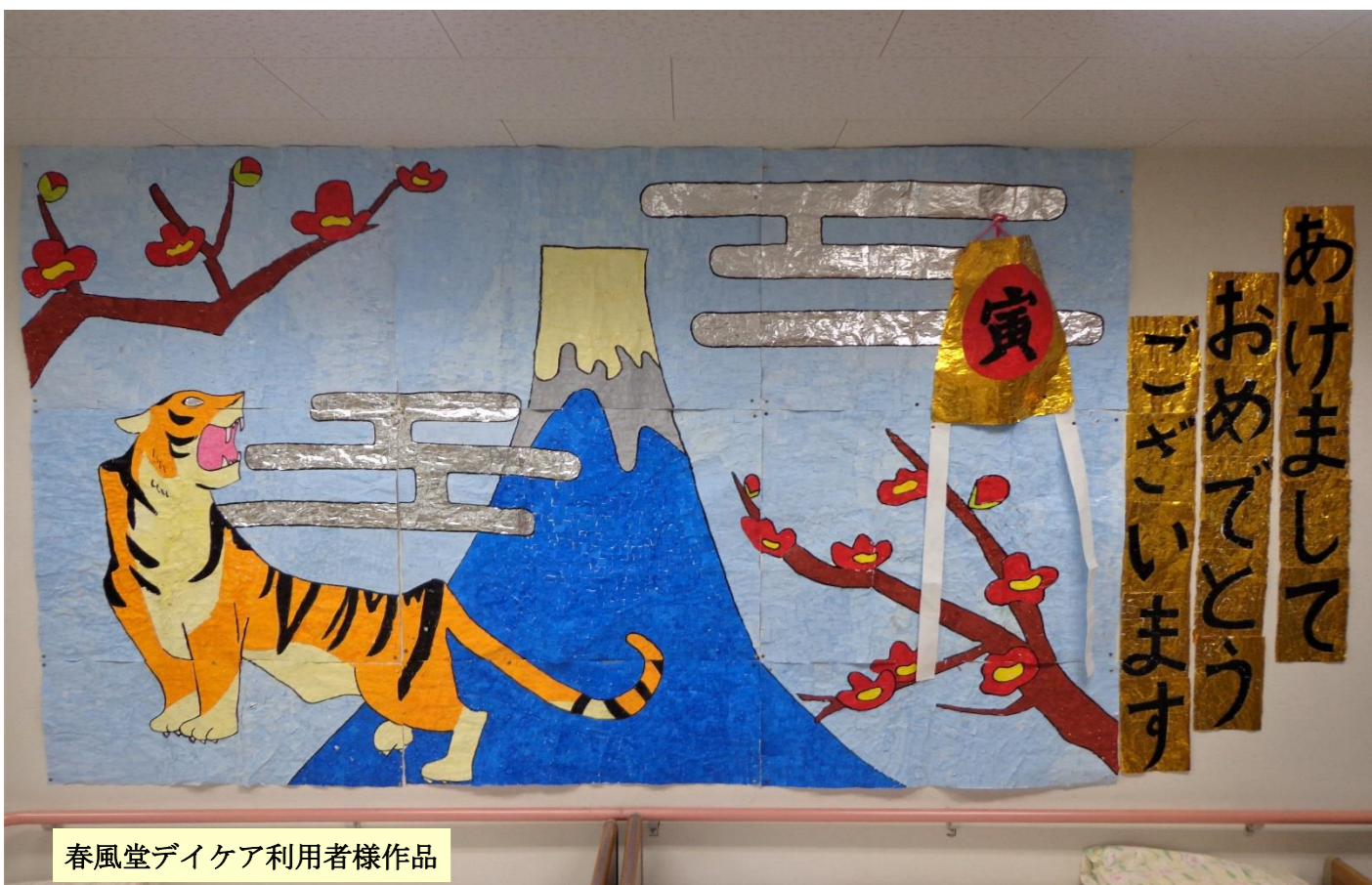
春風堂デイケア利用者様作品

居宅介護支援事業所 春風堂 小千谷市山谷 3622 (那由多の案内) TEL (0258) 83-1312