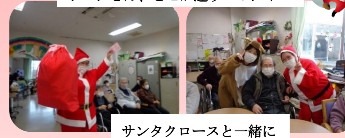
サンタクロースと一緒に