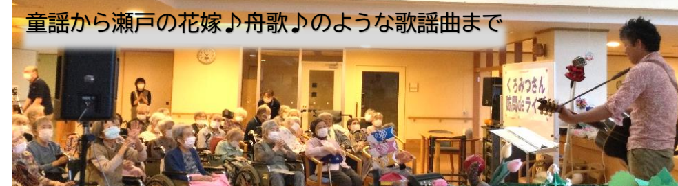
童謡から瀬戸の花嫁♪舟歌♪のような歌謡曲まで