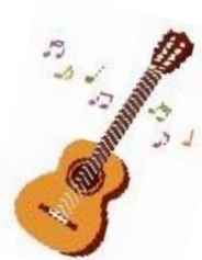
5年振り くらみつさんライブ