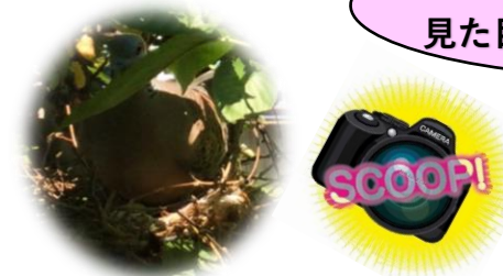
《桜園に珍客現る》 鳩が木に巣を作り卵を産みました