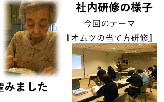
社内研修の様子 今回のテーマ 『オムツの当て方研修』