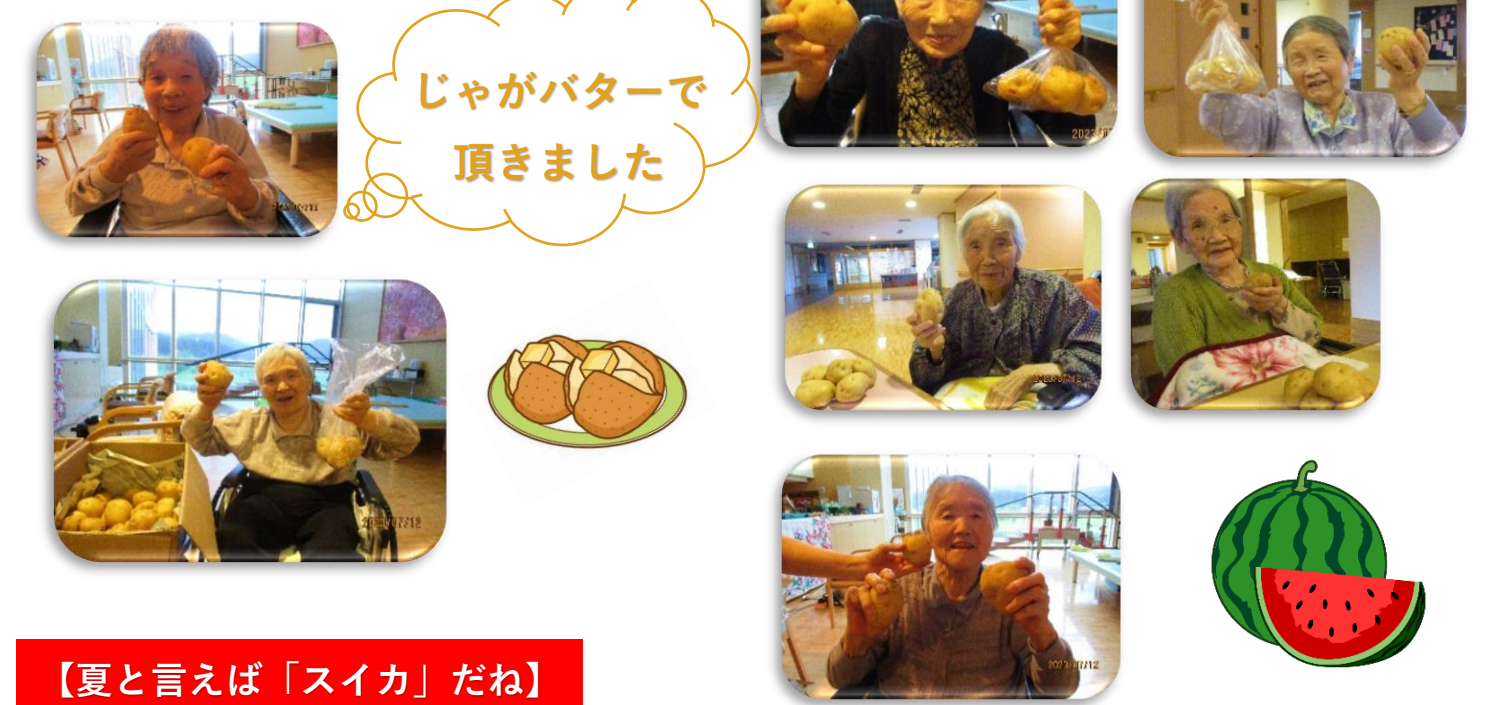
じゃがバターで頂きました