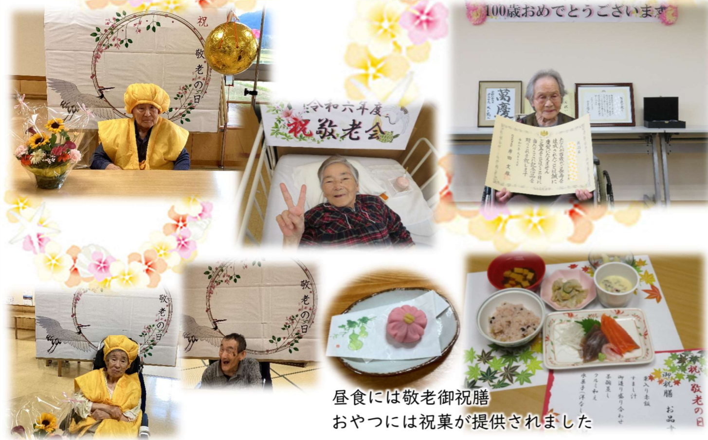
昼食には敬老御祝膳 おやつには祝菓が提供されました

また、18日には今年度100歳を迎えられたご利用者様に妙高市の表敬訪問がありました。妙高市からお祝いの色紙が送られ、国や県からも賞状と記念品が送られました。当日は職員も同席させていただきお祝いをさせていただきました。ご利用者の皆様がこれからも穏やかな毎日を遅れるよう今後も職員一同お手伝いさせていただきます。