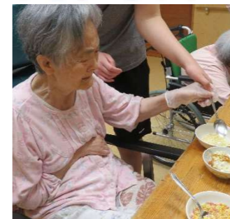
トッピング どれにしようかなあ

秋の食材りんごのソースを使ったおやつレクを楽しみました。クレープやアイスにソースを添えて飾りつけし、季節感を味わっていただきました。トッピングはそれぞれのお好みで選んでいただきました。