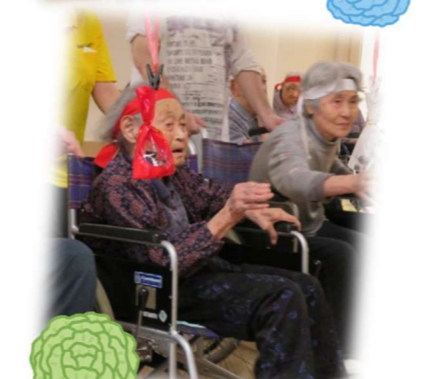
お菓子に向かって一目散