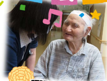
頑張りましょうね