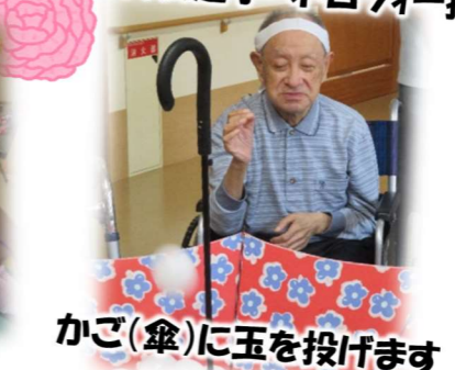
かご(傘)に玉を投げます