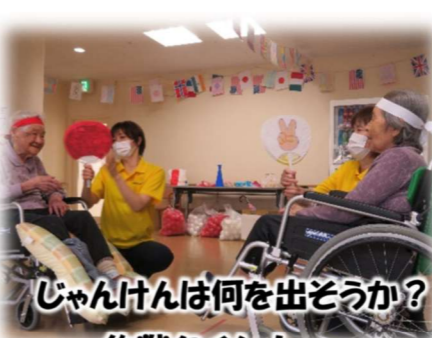
じゃんけんは何を出そうか？ 作戦タイム！