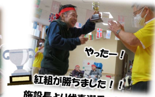
やったー！ 紅組が勝ちました！！ 施設長より代表選手へトロフィー授与