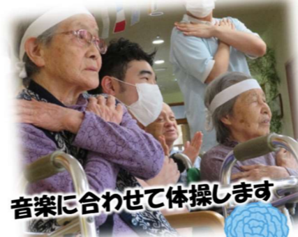
音楽に合わせて体操します

一大イベントである「7十の里大運動会」を6月27日に開催しました！はちまきを巻いて気合十分で臨みました。