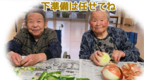
下準備は任せてね