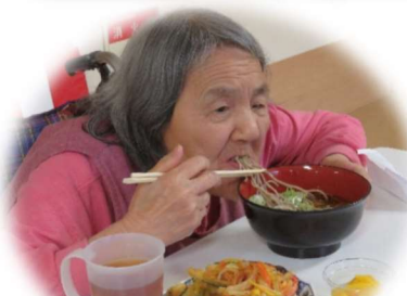
お蕎麦も美味しいよ

ベテランご利用者様お二人が大活躍。バイキング形式の会食は選ぶ楽しみも加わり、皆様大満足のご様子でした！おなかいっぱい楽しい時間になりましたね。