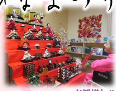
お雛様とハイ！チーズ！