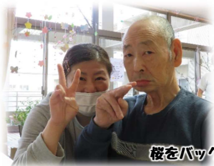
桜をバックに写真撮影春ですね～