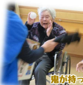
鬼が持っている箱をめがけてボールを投げます。