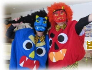
皆で力いっぱい鬼退治。鬼は～外！福は～内！