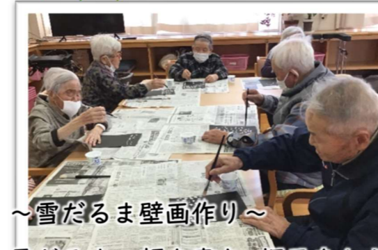
～雪だるま壁画作り～

雪だるまの顔を書き、帽子をかぶせました。雪が降っている様子は絵の具で表現しました。いろんな表情のかわいい雪だるまが完成！