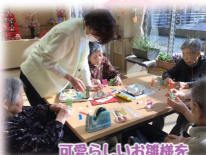
可愛らしいお雛様を手作りしました！！