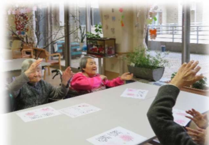
「北国の春」を歌いながらの体操、さくらさくらを合唱し茶話会がスタート。

3月28日ブナの里2階ホールにて観桜会を開催しました。桜を見ながら、カラオケや茶話会を楽しみました。今回はケーキ、甘酒、昆布茶、ノンアルコールビールなどをご用意し、それぞれ好きなものを選んでいただきました。