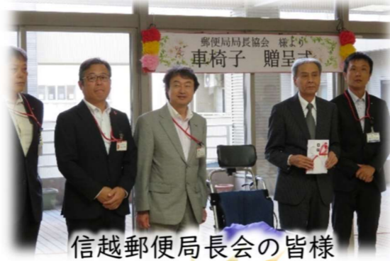
信越郵便局長会の皆様

また、当日は信越郵便局長協会様より、車椅子を寄贈いただきました。御厚意に心より感謝し、ご利用者様のために使用させていただきます。ありがとうございました。