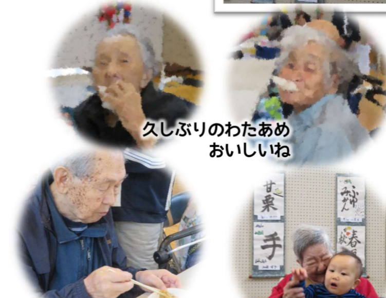
焼きそばに、豚汁。あったまるねえ