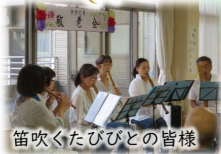
笛吹くたびびとの皆様

式典後には、「笛吹くたびびと」様による演奏会が行われました。優しい笛の音色に心癒され、懐かしの童謡では皆で合唱し、楽しい時間となりました。