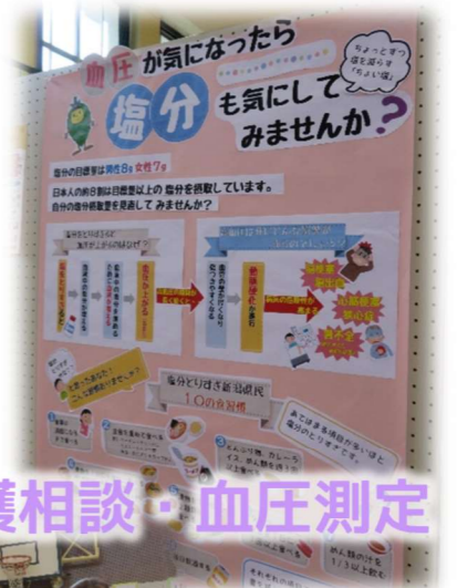
介護相談・血圧測定