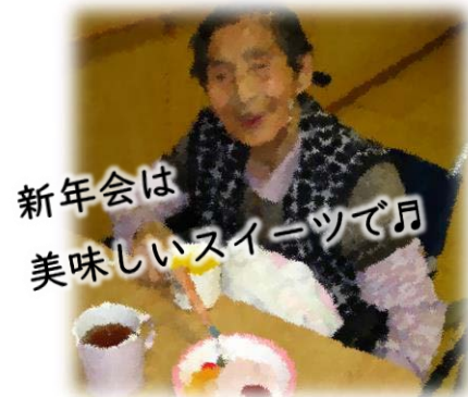
新年会は 美味しいスイーツで♪