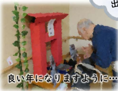
良い年になりますように…