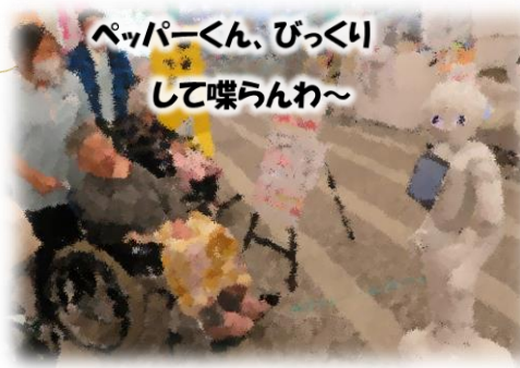
ペッパーくん、びっくり して喋らんわ～