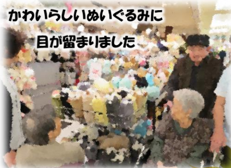
かわいらしいぬいぐるみに 目が留まりました