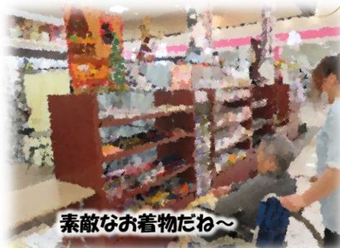
素敵なお着物だね～