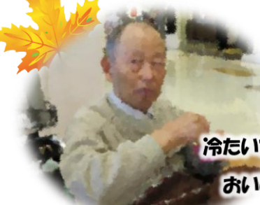
冷たいアイスが おいしいね～

お店を眺めた後には、お待ちかねのおやつタイム! 皆でアイスをいただきました。「久しぶりだわ。おいしいね。」と笑顔になる皆様。暖かな気候だったのでより一層おいしく感じられたのでしょうか。暖かくなったら、またお出掛けしましょうね。