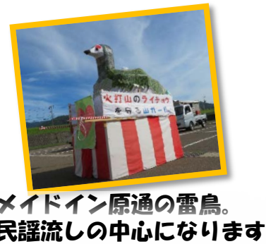
メイドイン原通の雷鳥。 民謡流しの中心になります

8月18日、原通自治会様と合同の納涼祭が行われました。 ブナの里 10周年である記念の年、自治会様のご厚意で職員の出番を多く作っていただきました。 今年は前日から涼しく、夜は少し肌寒く感じるほどでしたが、人が集まれば賑やかになり、寒さも忘れ楽しみました。