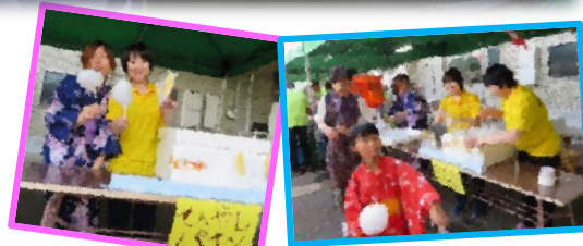
今年から始めました、冷やしパインです！わたあめも一緒にどうぞ～！