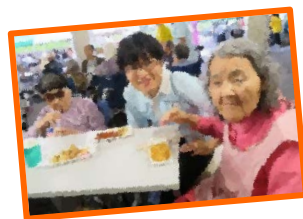
職員も一緒に楽しみました。