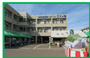
開始前の風景。 涼しくて良いお天気～！