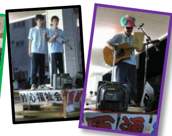
カラオケ大会！ ブナの里職員、頑張りました！