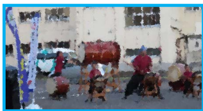
太鼓の演奏です。体の芯まで響くようでした。小さな男の子も頑張っていましたよ～！