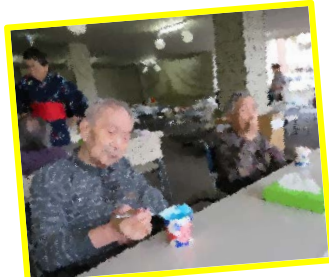
少し涼しいけど… かき氷食べましょ◎