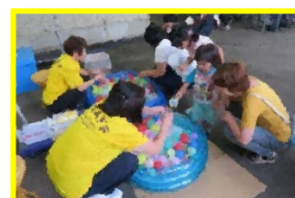
スーパーボールすくいほ、お子さんに人気でした。