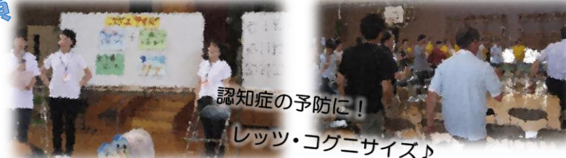
認知症の予防に！ レッツ・コグニサイズ♪