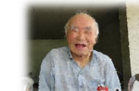
冷たいジュースが おいしい