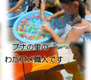
ブナの里の わたアメ職人です