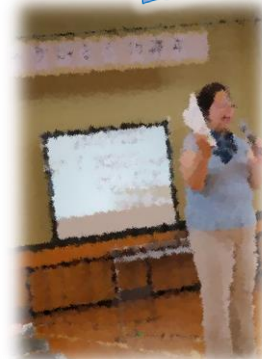
寸劇もご披露 いただきました