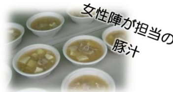
女性陣が担当の 豚汁