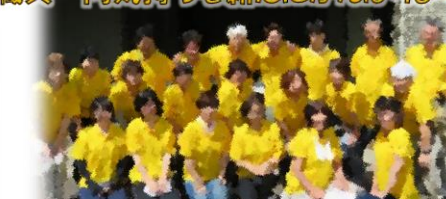
職員一同気持ちを新たにかんぱいます！！