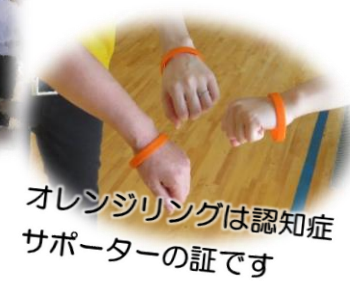
オレンジリングは認知症 サポーターの証です

記念公演には、新潟県立看護大学老年看護学原准教授、認知症オレンジサークルの皆さんをお招きしました。認知症についてユーモアを交えたわかりやすい説明、そして予防改善に有効である楽しいコグニサイズ体験、会場の空気が和んだ寸劇のご披露等、たいへん有意義な時間でした。認知症への理解をより深めていただけたことと思います。参加された皆様にはオレンジリングが配られました。