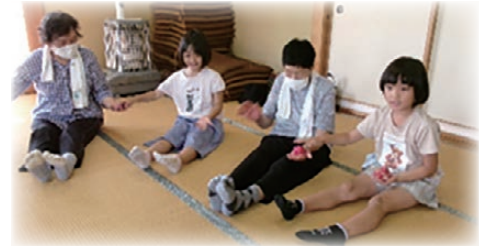
高清水サロン「雪割草」と放課後児童クラブとの交流