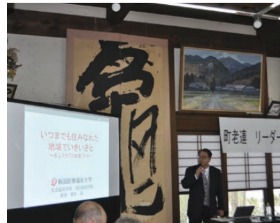
町老人クラブ連合会リーダー研修会で座談会