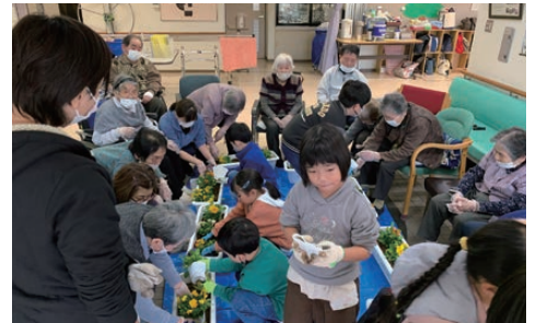
鹿瀬デイサービスセンター