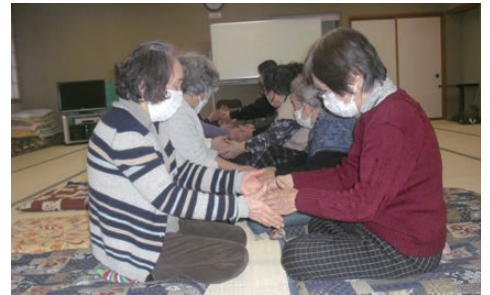
ふれあいデイサービス阿賀