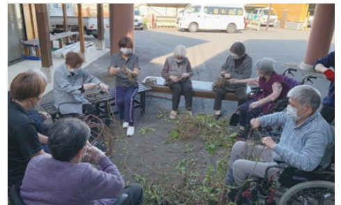
津川デイサービスセンター