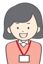
生活支援コーディネーター