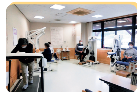
▲マシンをつかった体操(はつらつ健康クラブ)