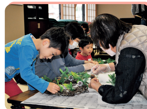
▲わんぱく★キッズサロン