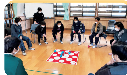
▲レクリエーションの様子(ふれあいデイサービス阿賀)

住み慣れた 地域・ご自宅で安心して 生活できるように お手伝いさせて いただきます