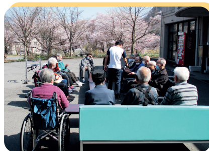
▲屋外でのお茶会風景