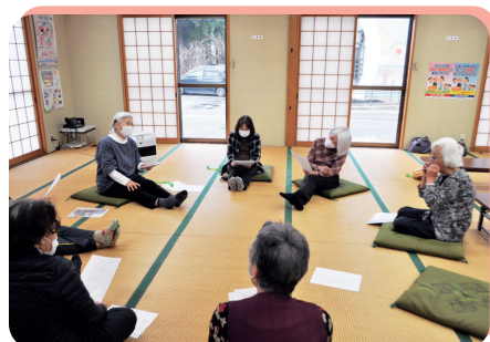
▲ふれあい・いきいきサロン