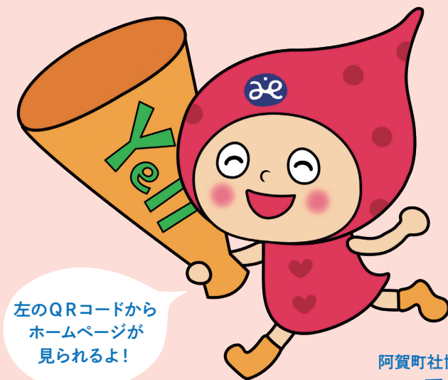
阿賀町社協キャラクター アエール