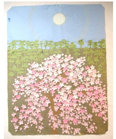
みごとなさくらアート