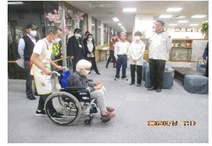
車いす使用方法をレクチャー