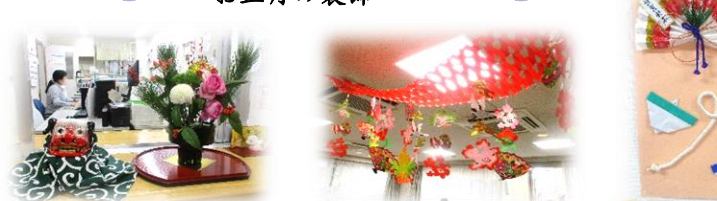
スタッフによるお正月のお花、天井につるされたお正月飾り、折り紙アート