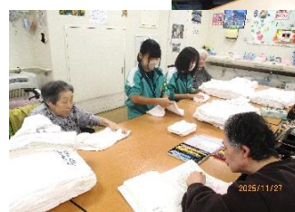
ご利用者と タオルたたみ の作業