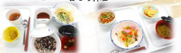
天ぷら・栗きんとん・伊達巻のお正月料理