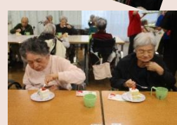
ケーキをおいしそうに 召し上がるご利用者