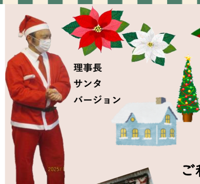
理事長 サンタ バージョン