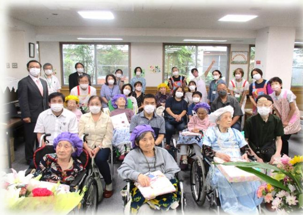
みんなで記念の写真