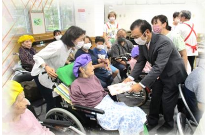
理事長より記念品贈呈

また、ご長寿のお祝い会ですので、ご利用者全員にプレゼントがありました。そして、当日の昼食は「卵豆腐のあんかけ」「豪華5品天ぷら」「お赤飯」など、ご長寿を彩る「豪華お祝い和膳」をお召し上がりいただき、ご利用者から大変よろこばれました。