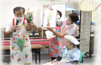
ご利用者の趣味をご紹介します