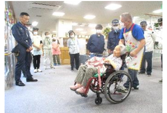
町会の方に車いす移動を伝授