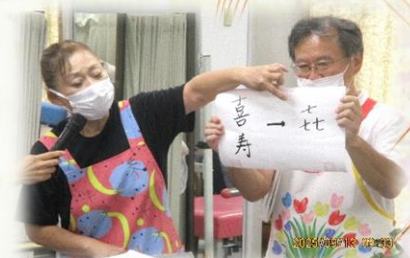
頭巾の由来など説明