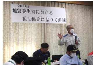
葛飾区防災主幹の講話