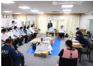
消防出張所長の講話