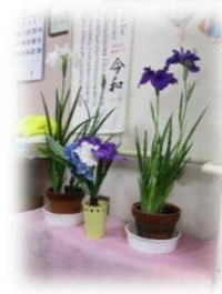
お借りした花菖蒲