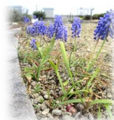
春の訪れを知らせるムスカリ 屋上庭園より