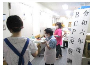
エレベーター停止想定 配膳訓練