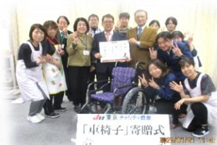
寄付の車いすと一緒に記念撮影