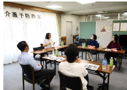
介護予防に関する相談・意見交換会