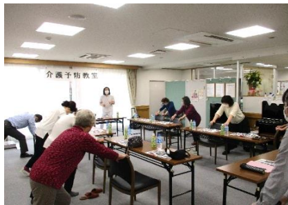
新井理学療法士による介護予防講座