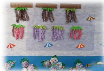
藤と紫陽花の花飾り