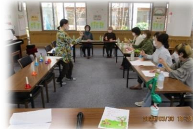
皆さんでハンドベル演奏をしました♪