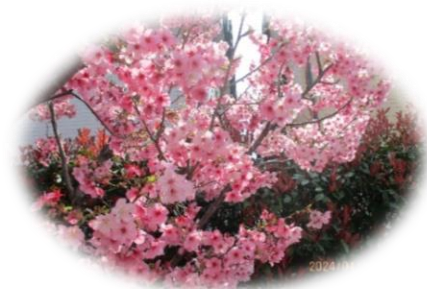
今年もきれいに咲いた正面前の陽光桜

今年度も引き続き、ご利用者、ご家族、関係者の皆様の特段のご支援とご協力の程よろしくお願いいたします。