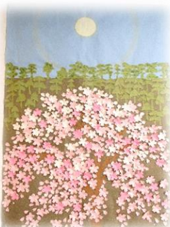
桜・菜の花の飾り