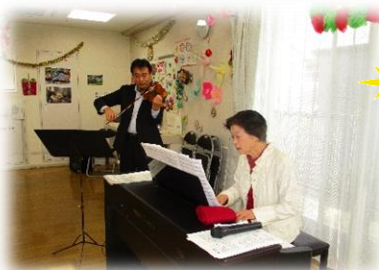
ヴァイオリンとピアノの演奏

聞かれました。施設の装いも、クリスマスツリーやモミの木、サンタクロースの飾りつけや、サンタやトナカイ、ダンサーの七色のコスチュームなど、思い思いに身を包み、まるで、別世界の夢のようなひと時でした。また、恒例になりました、施設からご利用者へのプレゼント、クリスマスにちなんだ豪華ランチ、ショートイチゴケーキ、いろいろジュースなどの飲食提供もあり、ご利用者の笑顔が絶えない、笑い声が絶えない1日となりました。