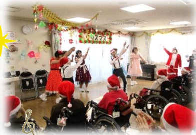
東京ブギウギ・ダンス