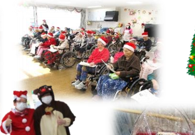
施設長サンタとトナカイ