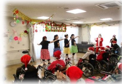
東京ヘイヘイブギウギ・ダンス