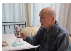
ノンアルコールビールうまい！