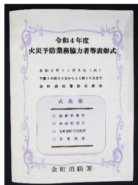
火災予防業務協力者等 表彰式 式次第

令和4年11月8日(火)火災予防業務協力者であるとして、金町消防署長より表彰されました。