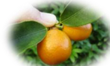
屋上テラスに 実ったきんかん