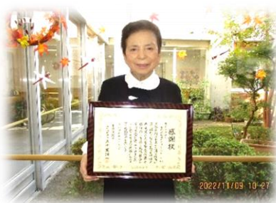
感謝状を受賞した 理事長