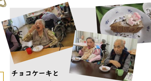
チョコケーキと コーヒー