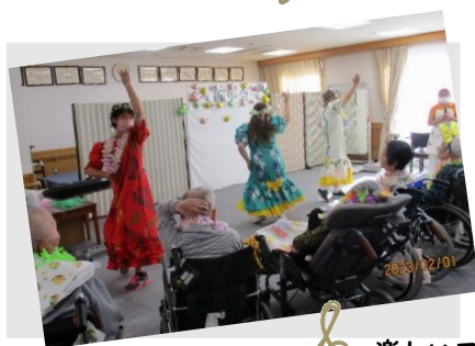
楽しいフラダンス