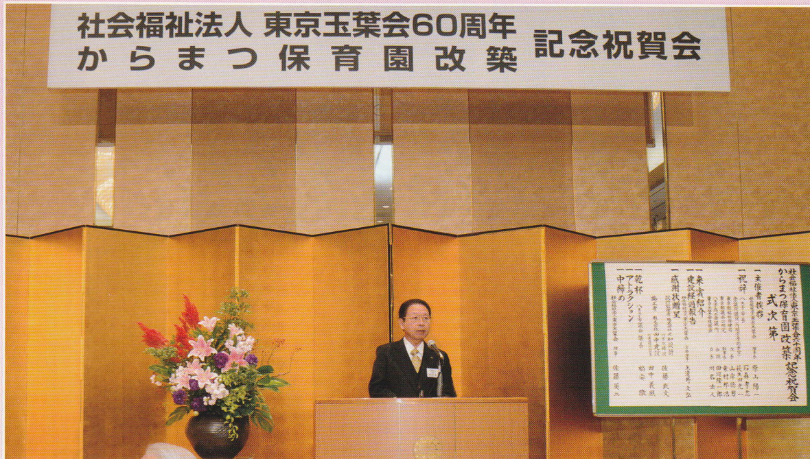
原山理事長あいさつ