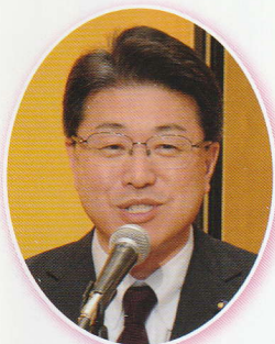
東村東京都議会議員 (都議会公明党幹事長)