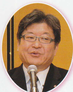
萩生田衆議院議員 (内閣官房副長官)