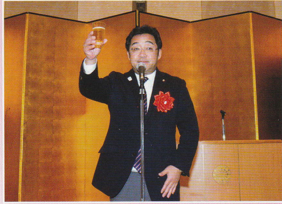
乾杯 福安八王子市議会議長