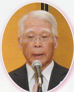
田辺八王子商工会議所会頭