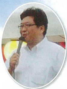
萩生田衆議院議員