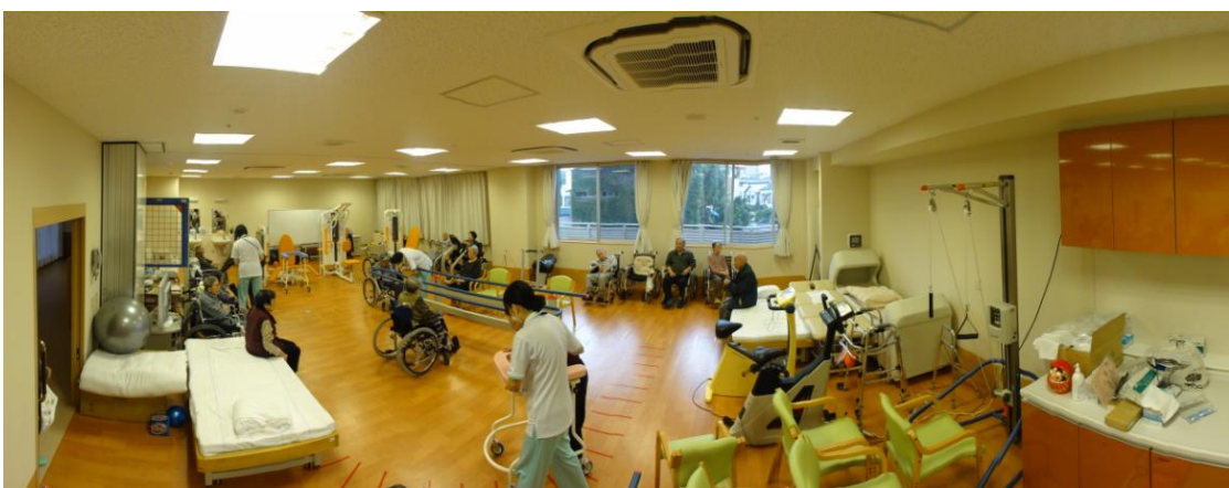
機能訓練室の様子