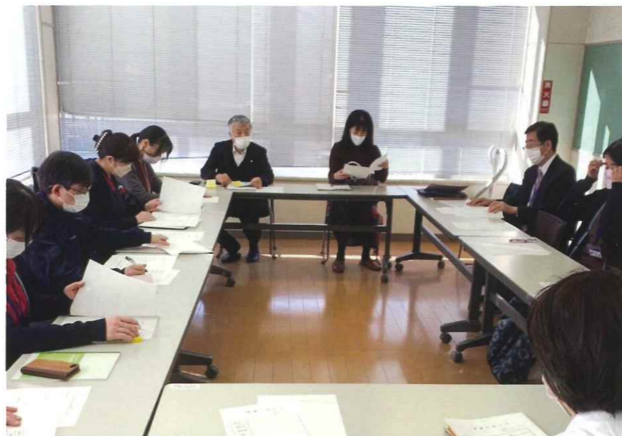
メンタルヘルス相談説明会の様子

最近、「パワハラ」や「セクハラ」という言葉を耳にします。「ハラスメント」は、人を傷つけたり不快にする嫌がらせ、いじめのことを指す言葉です。顧客からのハラスメントは「カスタマーハラスメント」略して「カスタハラ」と言われ、理不尽なことを要求してくるものを指し、苦情とは違ったものです。いずれにしても言動によって受けたハラスメントは、人の心を深く傷つけるものです。