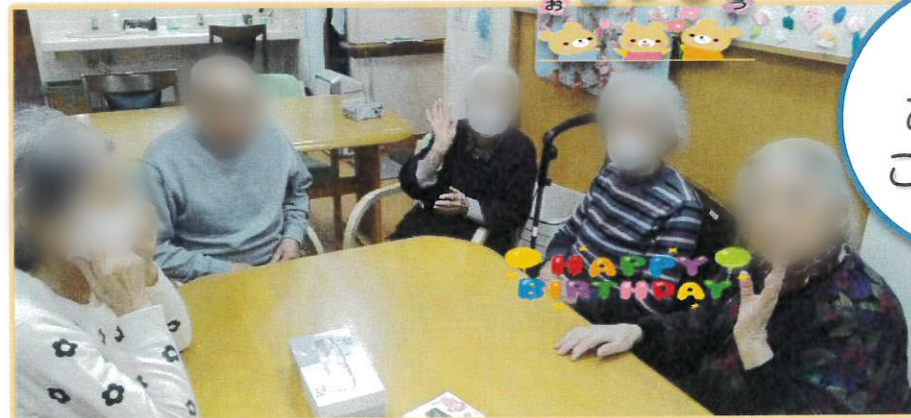
誕生日 おめでとう ございます！