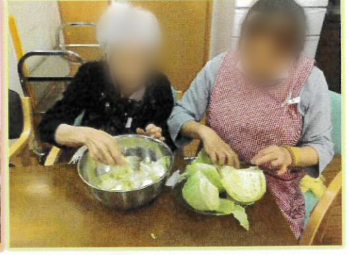
皆さまと一緒に食事の支度をしました！ やしそばパーティーです。