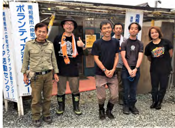
ボランティアに活動報告を 終えたところ

むさしのかいふくしまひさいちしえんかつどう 難しいとのこと。求めに応じて支援 していきます。（熊谷）