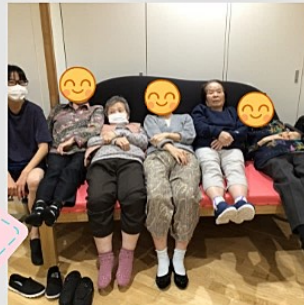
みんなでまったり

ここではショートステイ専任の介護ワーカーにより、出来る限りご本人様の活性化に寄与させて頂こうと、介護業務の合間に、個々の状況に合わせて体操や歌・塗り絵や脳トレ・機能訓練士による訓練・管理栄養士によるおやつレクリエーション等を実施しています。しかし、何と言っても元気の源は話す事と笑う事ですね。沢山笑って元気に帰宅して頂ければ、と思っております。