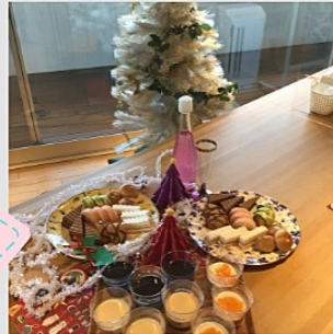
クリスマスケーキパーティング

暮らしの中では、突発的な出来事での急な外出や出張・先の見えない日々の介護による閉塞感や疲労からくる介護者様自身の体調不良・等々、様々な事が起こります。このように、ご自宅で介護が一時的に不可能となった場合のお助け部隊がショートステイ事業です。