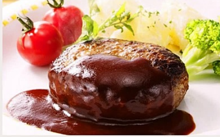
デミグラスハンバーグ