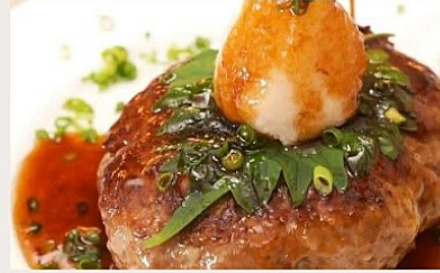
和風青じそおろし ハンバーグ

ハンバーグの選択食は職員からご利用者様にヒアリングをしてお利用者様自身が決めています。 返答が難しいご利用者様は日々の食事の様子を見て職員が判断して決めています。