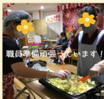
職員準備頑張っています！