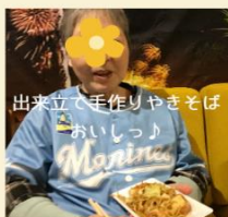
出来立て手作りやきそば おいっしょ