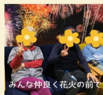
みんな仲良く花火の前で