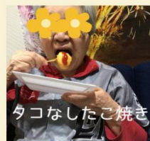
タコなしたご焼き