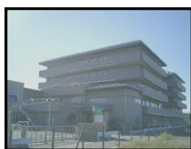
豊かな里 110床 豊田 1-22-2 042-589-2366