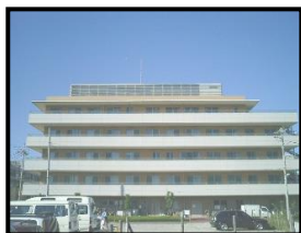
マザアス日野 106床 万願寺 1-16-1 042-582-1661