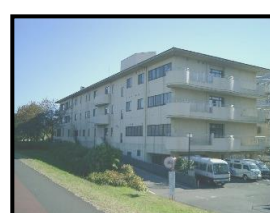
浅川苑 77床 高幡 864-4 042-593-1165