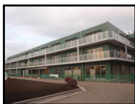
シンフォニア 82床 東平山 3-1-19 042-514-9715