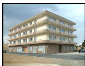
あすなろ 86床 百草 1042-17 042-593-1813